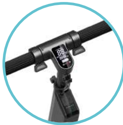
ECRAN TACTILE & PORT USB