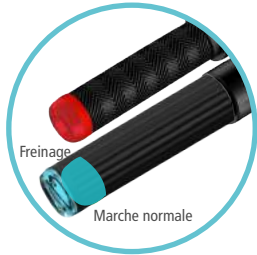
LEDs D'INDICATION DE FONCTIONNEMENT