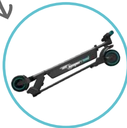
PLIAGE FACILE & POIGNÉE DE TRANSPORT