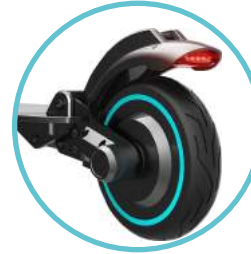
FEU STOP ARRIÈRE & FREIN MÉCANIQUE