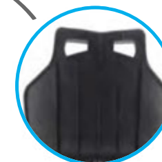
SIÈGE BAQUET + de confort