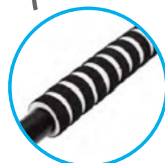
RENFORTS DE POIGNÉES EN MOUSSE + de confort