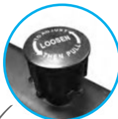
VIS DE SERRAGE + de sécurité