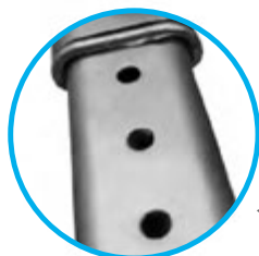
TAILLE RÉGLABLE + pratique