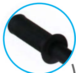
REPOSE-PIED ANTIDÉRAPANT + de sécurité