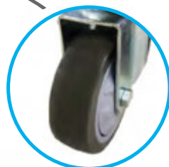
ROUE MOBILE EN GOMME + maniable